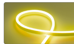
арт. 29565 жёлтый