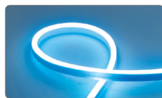
арт. 32713 синий