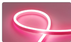
арт. 32712 красный