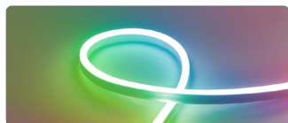
арт. 52112/52111/51975 RGB

8 W/m 72 LED/m 5/10/50m (в бобине) LS720