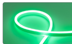
арт. 32714 зеленый